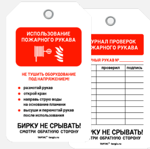
Бирка «Использование пожарного рукава»

Размер бирки: 70 × 115 мм Ø люверса: 4 мм