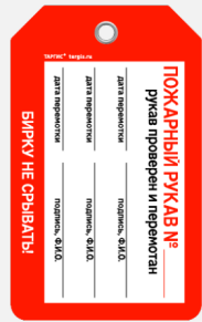
Бирка «Пожарный рукав»

Размер бирки: 70 × 115 мм Ø люверса: 4 мм